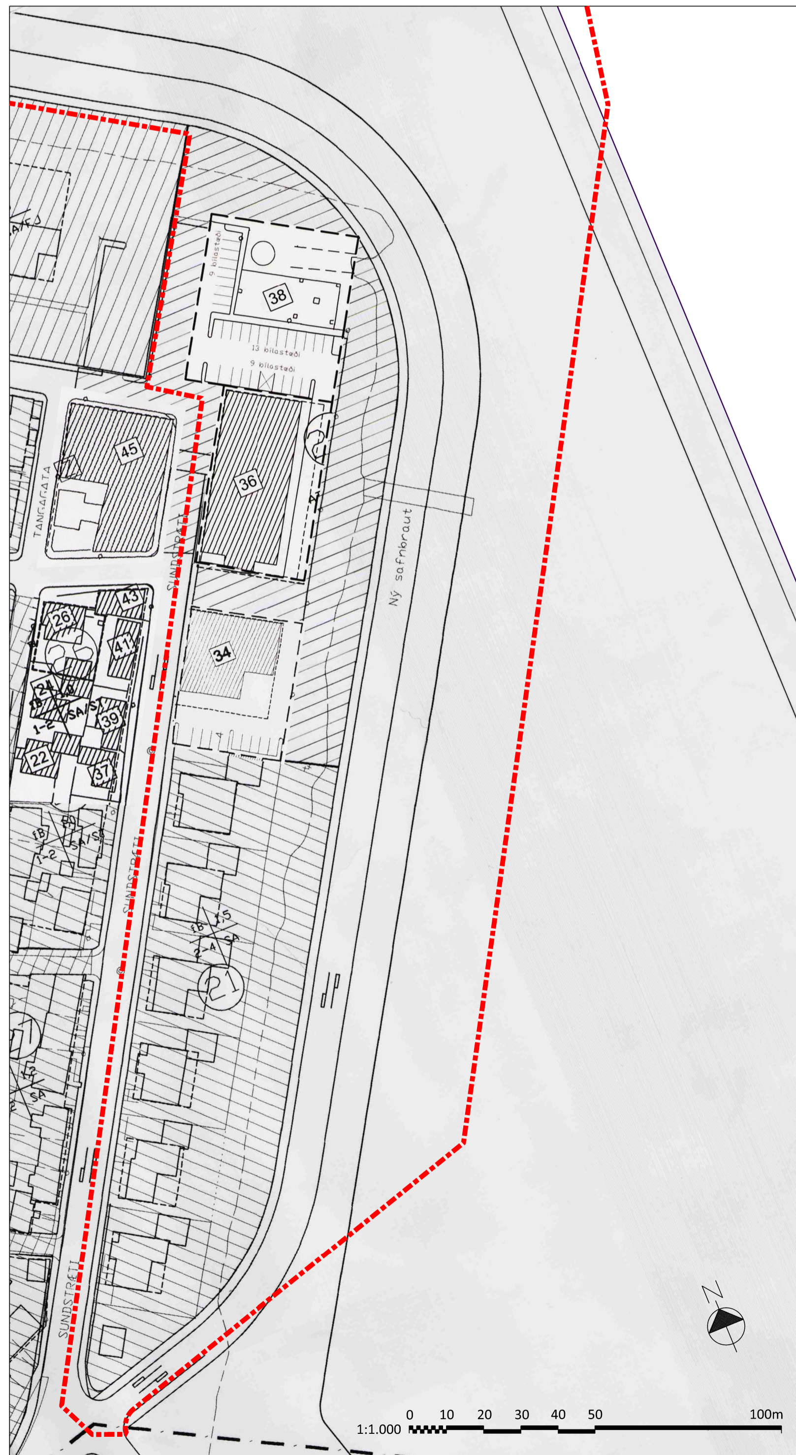
GILDANDI DEILISKIPULAG M.S.BREYTINGUM