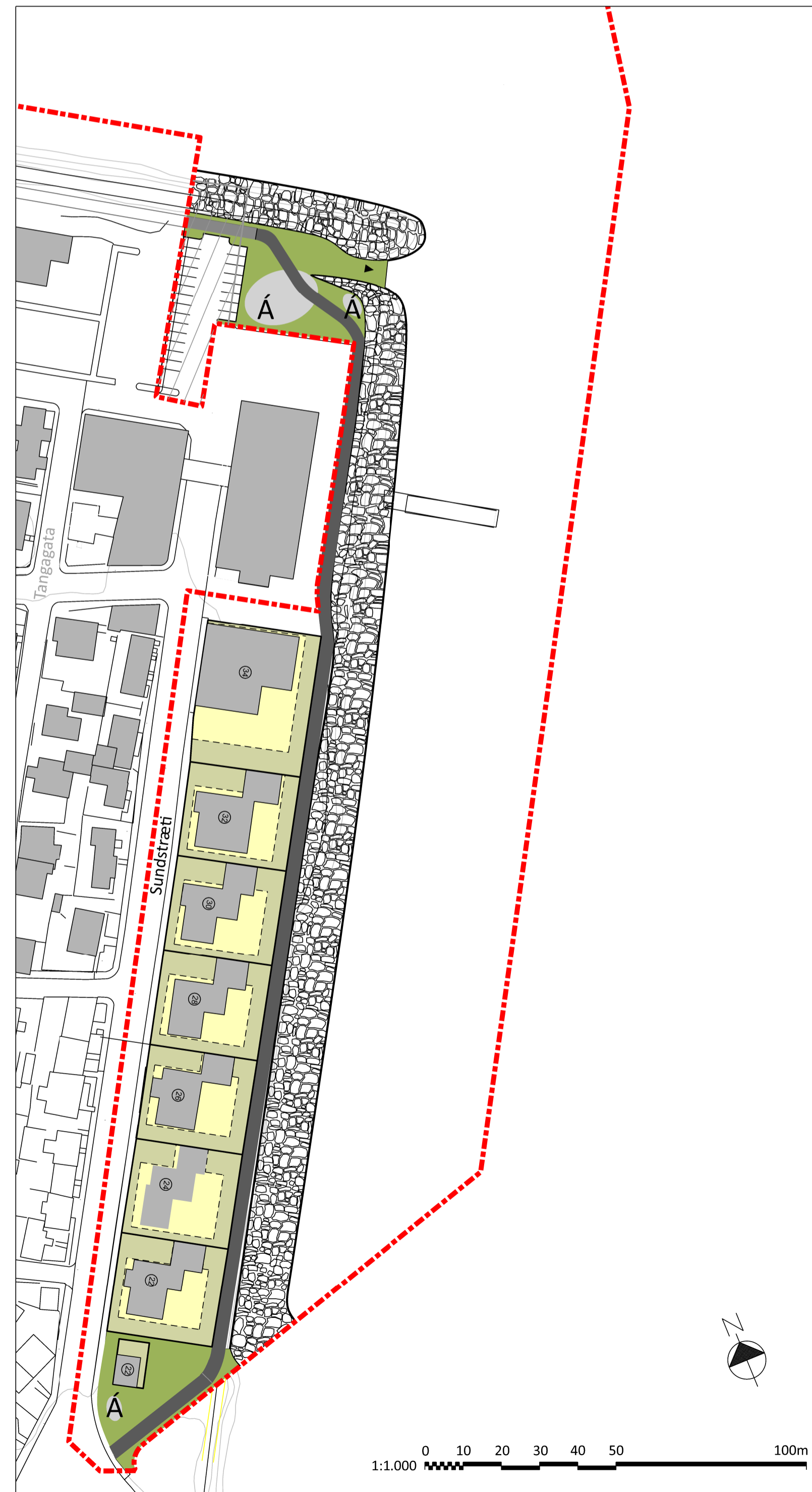
TILLAGA AÐ DEILISKIPULAGSBREYTINGU