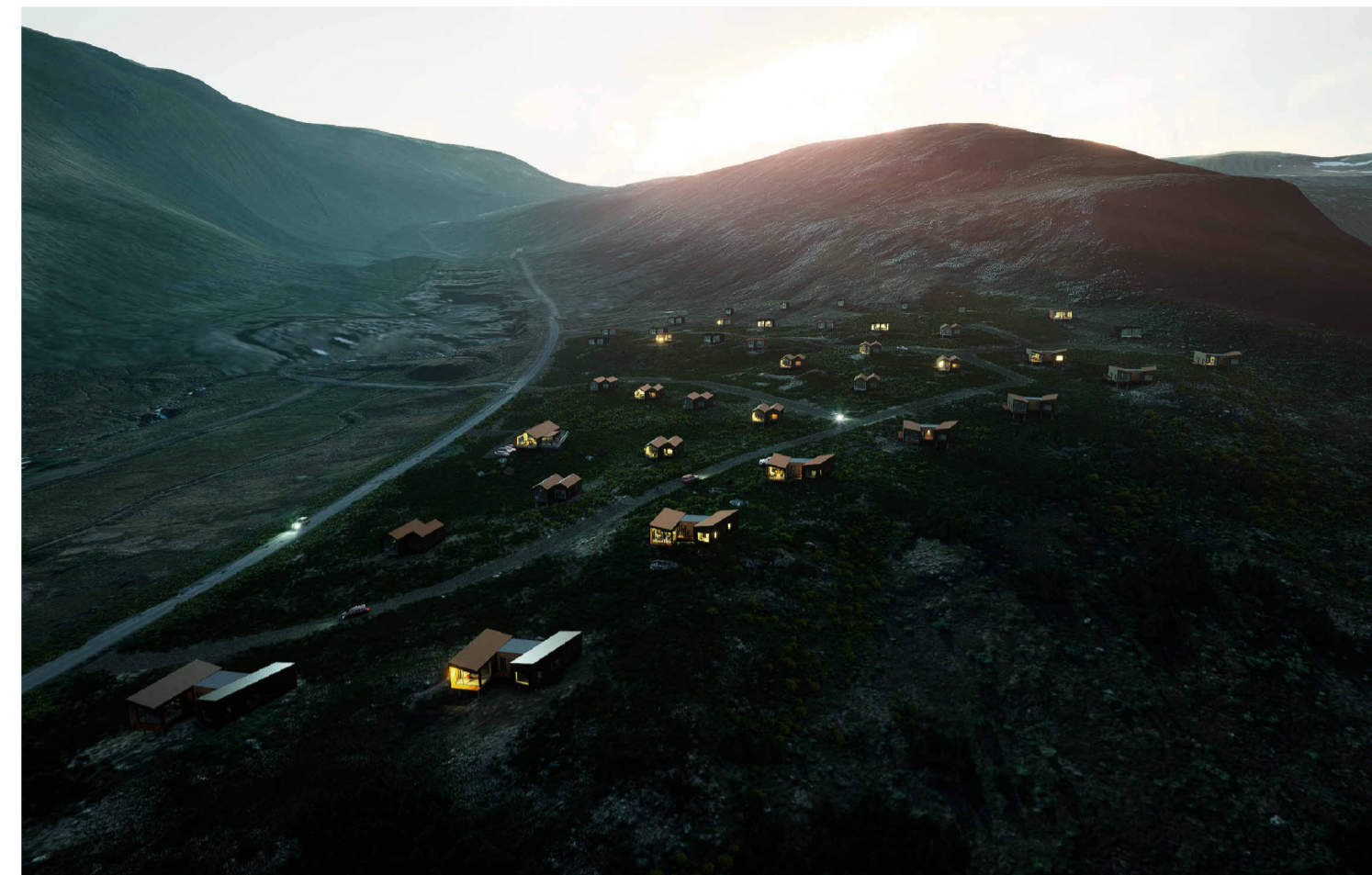
Skipulagssvæði að kvöldlagi