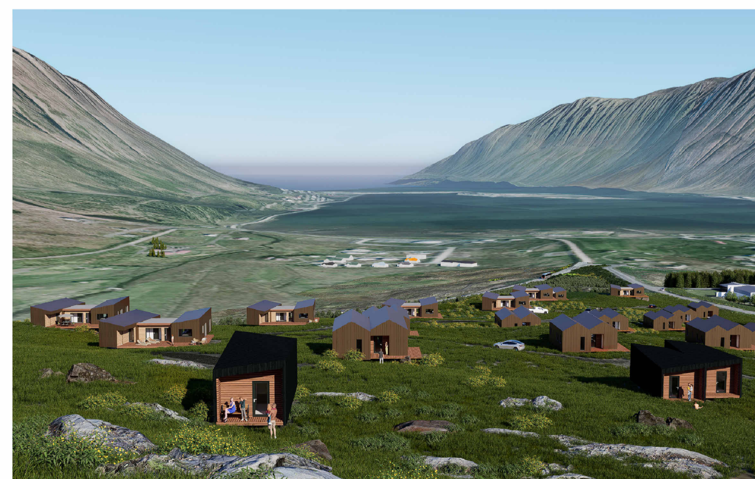
Horft yfir skipulagssvæðið út Skutulsfjörð