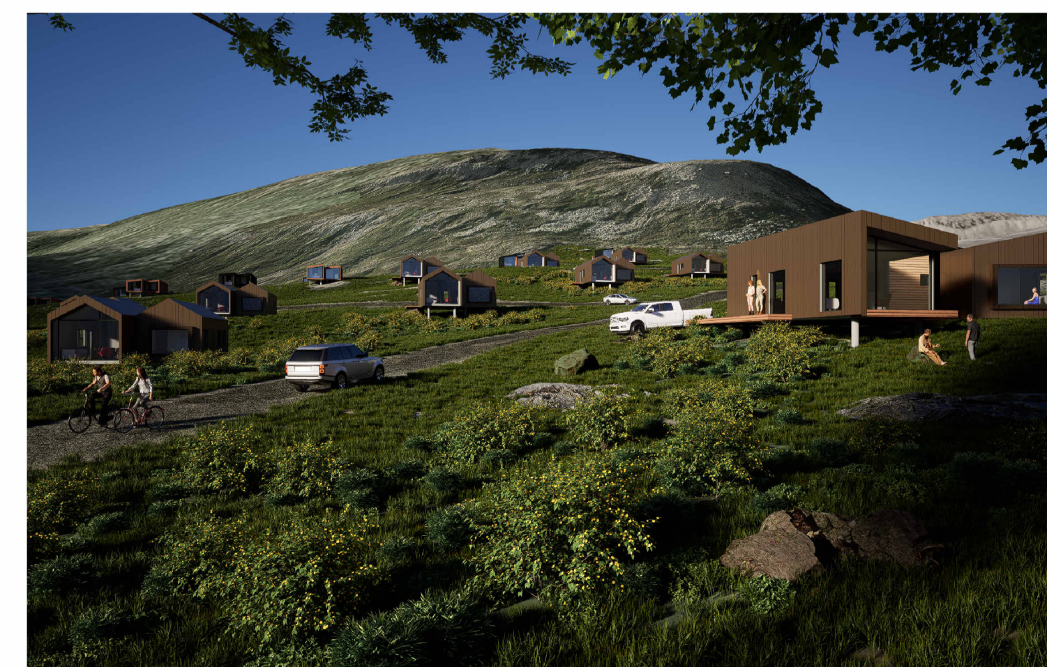
Stemningsmyndir af fristundahúsum

Þrívíddarmyndir á uppdrætti þessum sýnir þéttleika fristundabyggðar og afstöðu bygginga sín á milli.