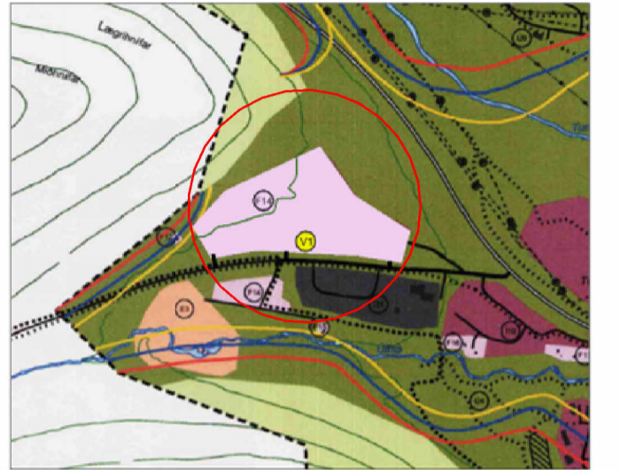
Hluti af breyttu aðalskipulagi

Deiliskipulag þetta sem, fengið hefur meðhöndlun í samræmi við ákvæði 2.mgr. 40.gr. skipulagslaga nr. 123/2010 var samþykkt í _____