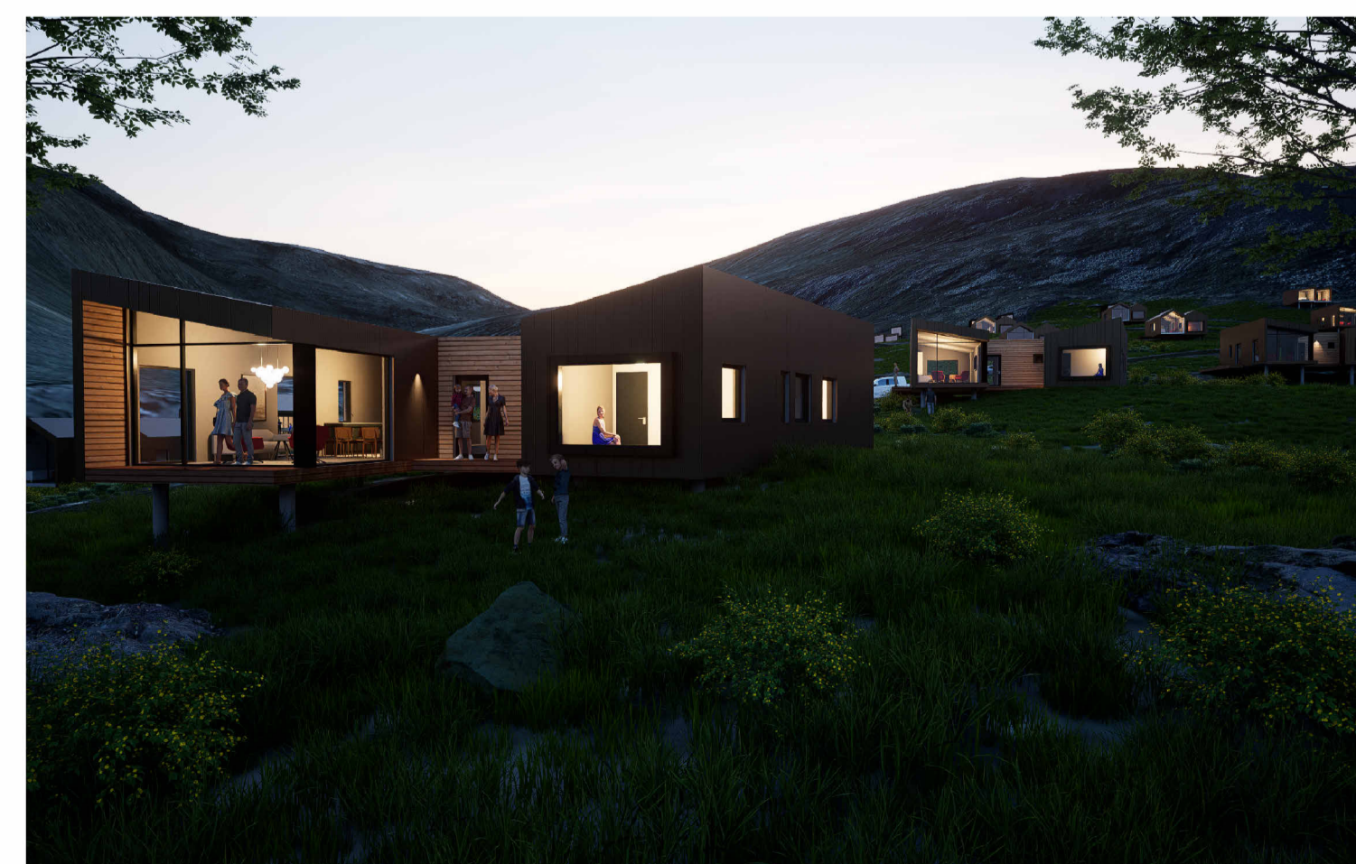
Stemningsmyndir af fristundahúsum