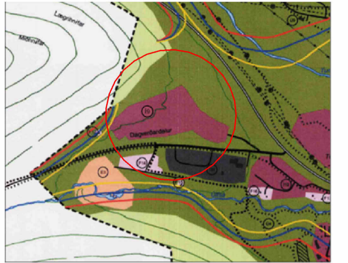
Hluti af gildandi aðalskipulagi ÍS