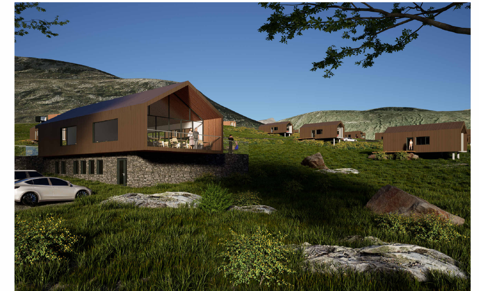
Möguleg útfærsla að þjónustuhúsi