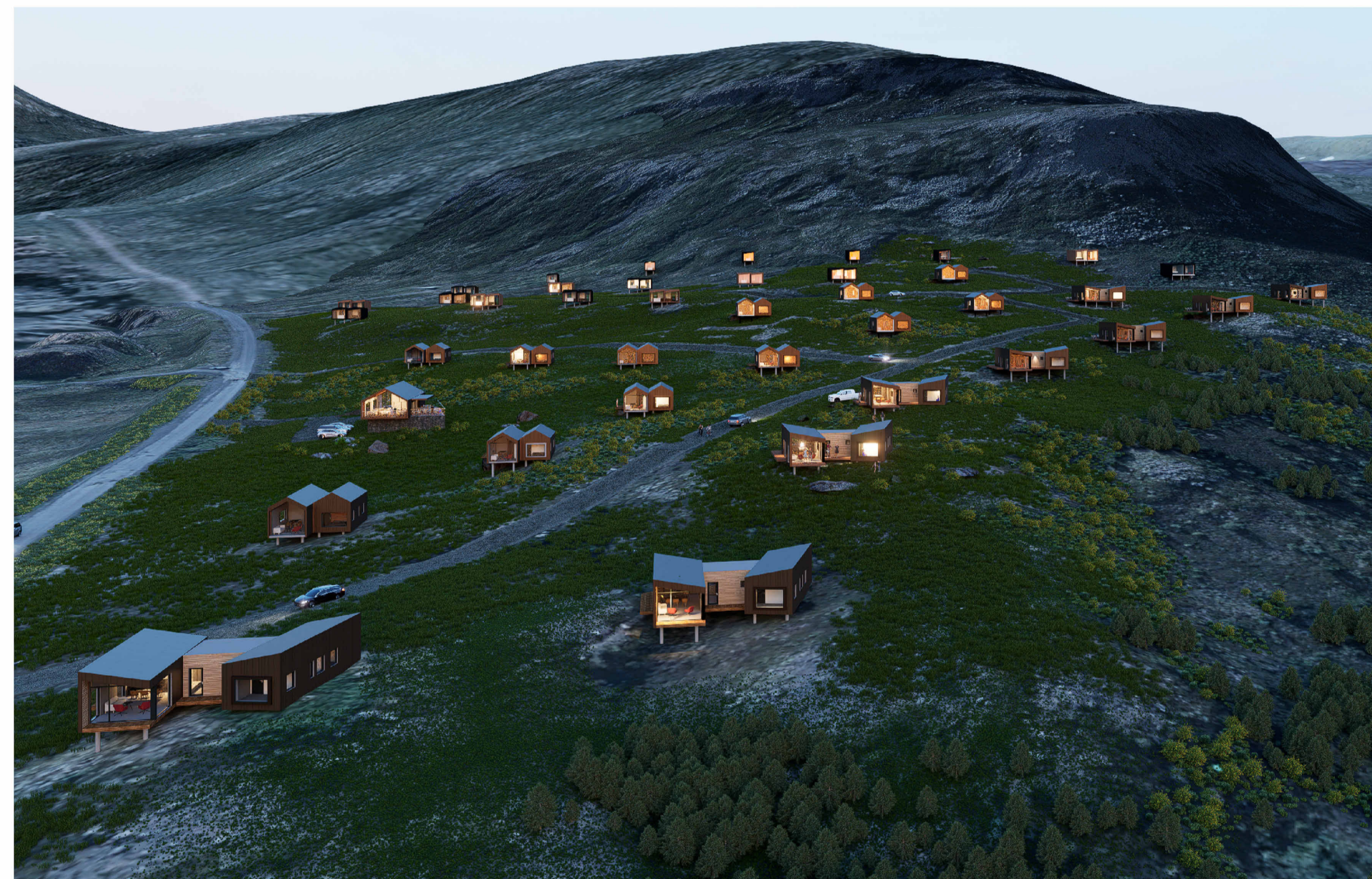
Yfirlit yfir skipulagssvæðið