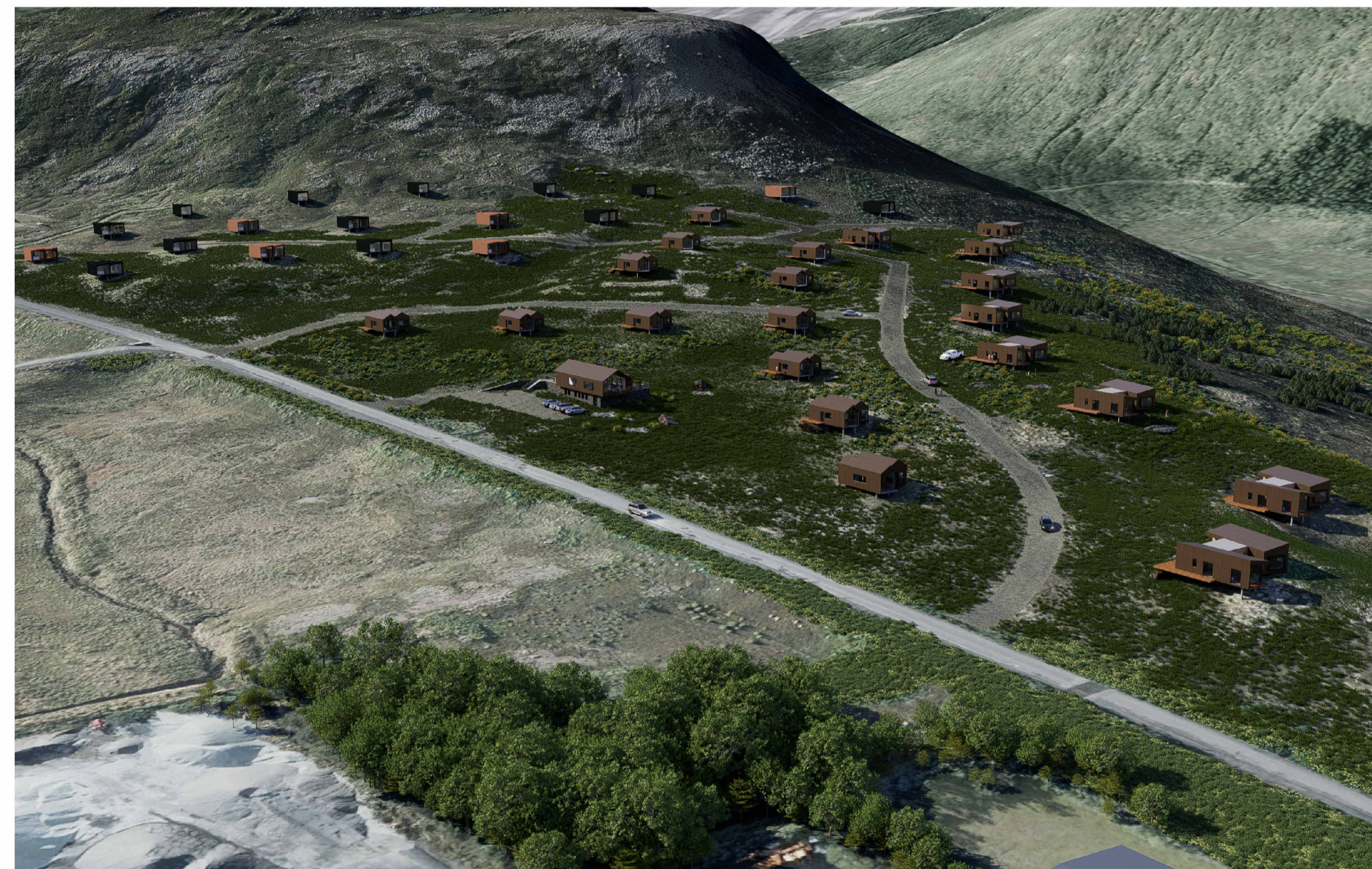
Yfirlit yfir skipulagssvæðið