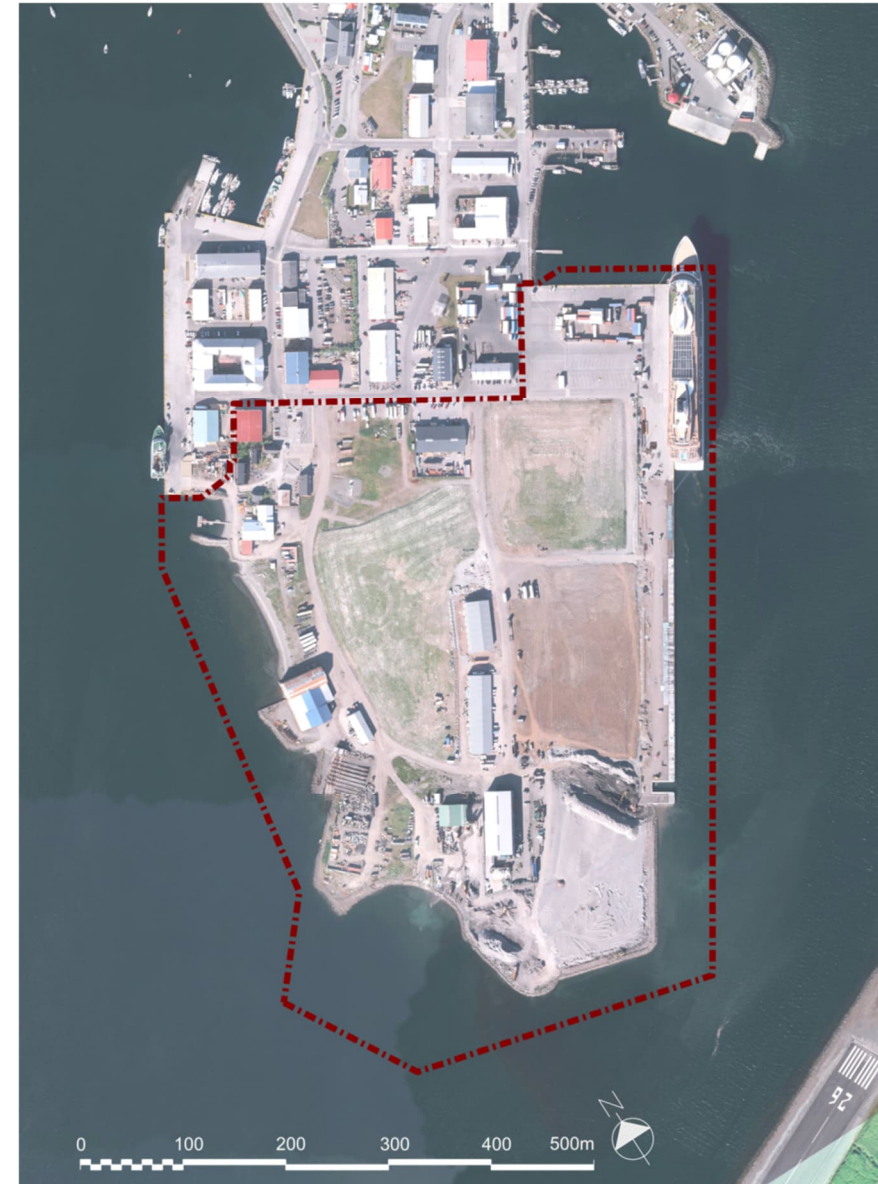
Mynd 1 Afmörkun svæðis sem aðalskipulagsbreytingin tekur til. (Mynd frá Loftmyndum ehf., tekin 2023)

Hvati skipulagsbreytinga á Suðurtanga (Mynd 1) er aukin eftirspurn atvinnulóða á Ísafirði síðustu misseri. Í núgildandi aðalskipulagi og gildandi deiliskipulögum á tanganum er ekki gert ráð fyrir þeim umsvifum sem nú eru á svæðinu og eru fyrir séð, m.a. í tengslum við ferðaþjónustu, fiskeldi og annan sjávarútveg. Skapa þarf rými fyrir þessar og aðrar atvinnugreinar og samræma við sífelld fjölbreyttari starfsemi hafnarinnar á Ísafirði. Ísafjarðarhöfn hefur þróast úr því að vera fyrst og fremst fiskihöfn yfir í það að þjóna fjölbreyttri flóru báta og skipa í takt við stefnu sveitarfélagsins og hafnarinnar. Samhliða aðalskipulagsbreytingunni er unnið að endurskoðun tveggja deiliskipulaga á tanganum. Ráðgjafi við skipulagsgerðina er Verkís.