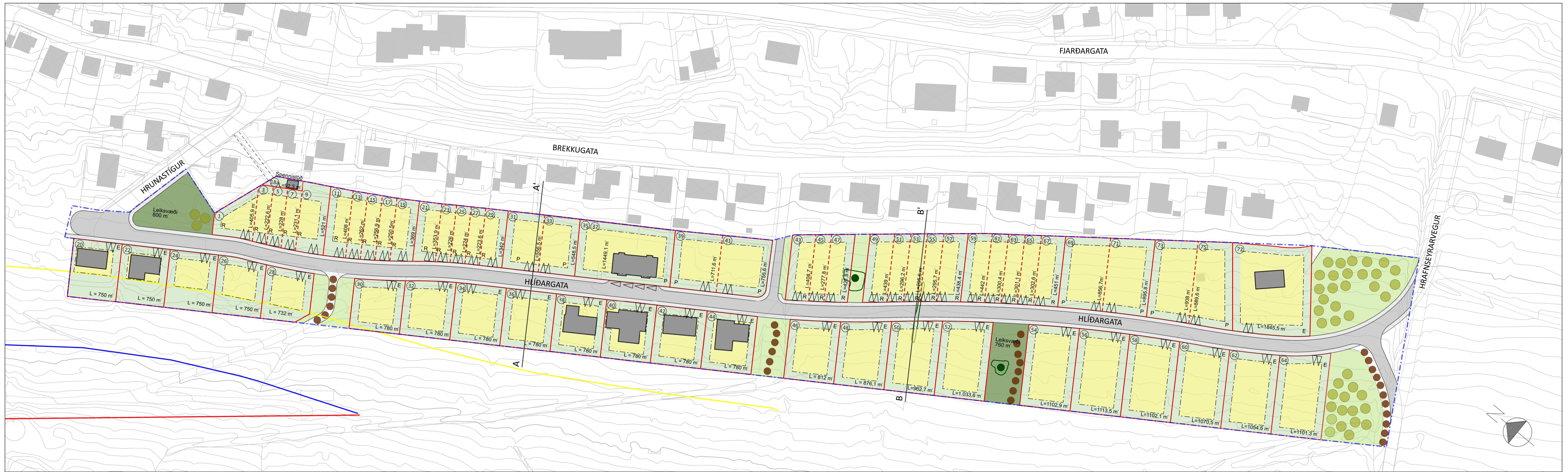
TILLAGA AÐ DEILISKIPULAGI