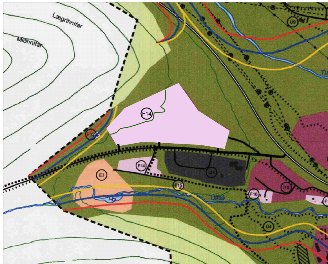
Tillaga að breytingu á aðalskipulagi, þéttbýlisuppráttur mkv. 1:10.000