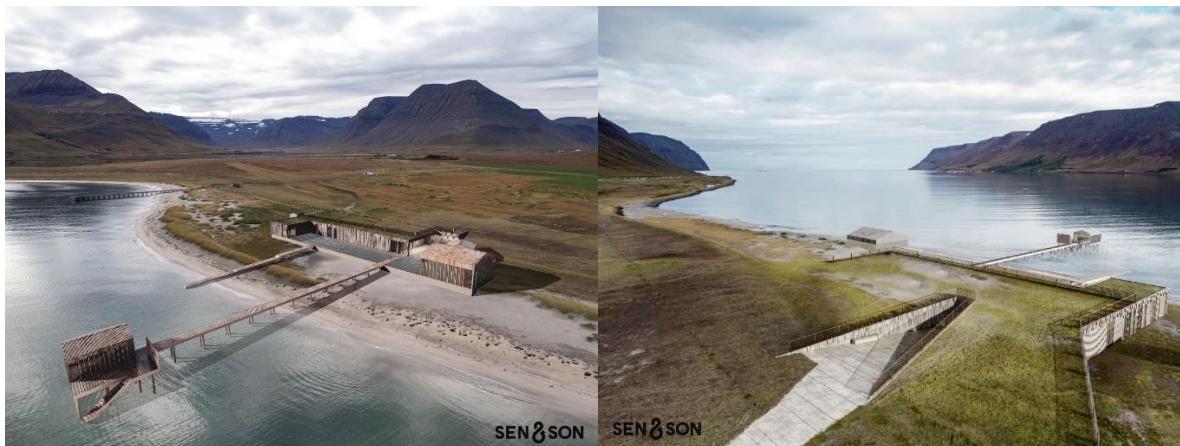
MYND 1. Hugmyndir um uppbyggingu baðastaðarins.