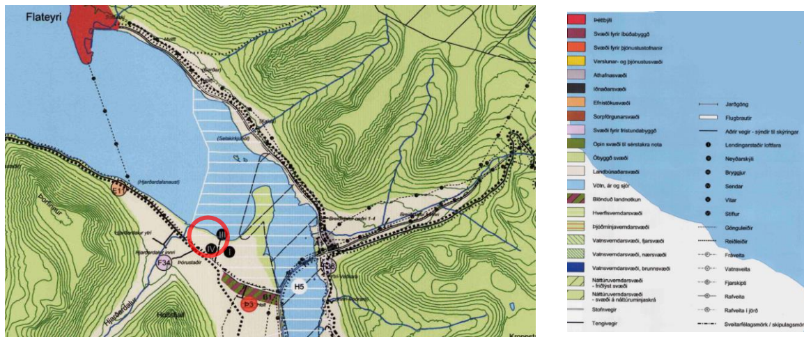
MYND 4. Hluti af Aðalskipulagi Ísafjarðarbæjar 2008-2020. Skipulagssvæðið er innan rauða hringsins.

Fyrirhuguð framkvæmd fellur vel að stefnu sveitarfélagsins um að auka aðráttarafi ferðamanna á Vestfjörðum auk þess sem fjölbreytt atvinnulíf styður við búsetu á svæðinu. Eins og fyrr segir er svæðið vinsælt hjá sjósundsfólki og ferðamönnum og með uppbyggingu á svæðinu mun svæðið verða enn meira aðráttarafi bæði fyrir ferðamenn sem og heimamenn.