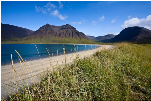
MYND 2. Myndir frá Holtsbryggju og nágrenni

Ofan við hvíta fjöruna taka við melgresisflákar, og þar fyrir ofan lítt grónar sandöldur. Samkvæmt vistgerðarkortlagningu 1 Náttúrufræðistofnunar eru vísbendingar um að þar sé Grashólavist sem finnst á strandsvæðum þar sem sandhólar hafa gróið upp og myndað vel grónar öldur og hóla upp af strönd. Verndargildi þeirrar vistgerðar er hátt og vistgerðin er á lista Bernarsamningins frá 2014 yfir vistgerðir sem þarfnast verndar. Eftir því sem komið er hærra upp í land, eykst jarðvegurinn, og næst þjóðvegnum eru ræktuð tún í landi Þórustaða.