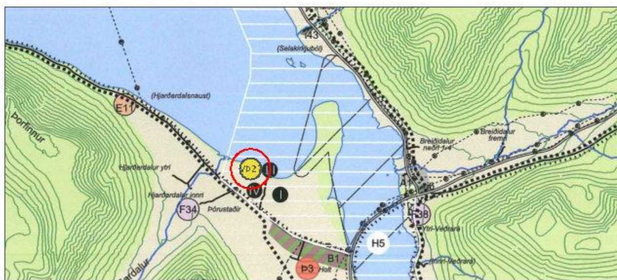
BREYTTUR AÐALSKIPULAGSUPPDRÁTTUR 1:50.000