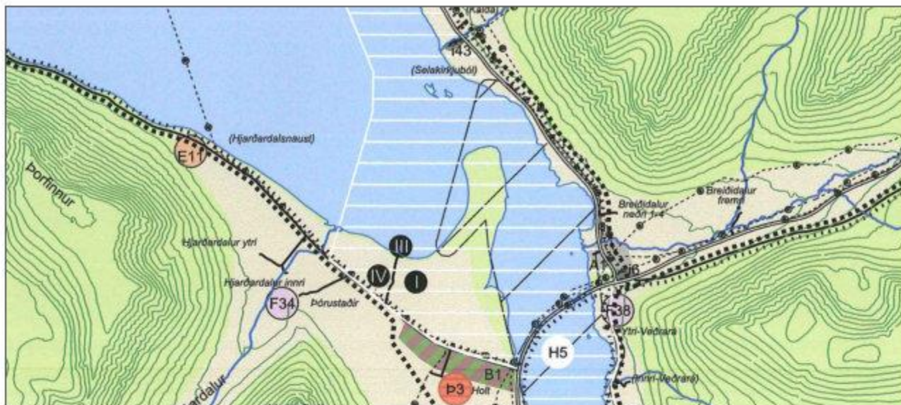
GILDANDI AÐALSKIPULAG 1:50.000

Sveitarfélagsuppdráttur, breyting á landbúnaðarsvæði/óbyggðu svæði