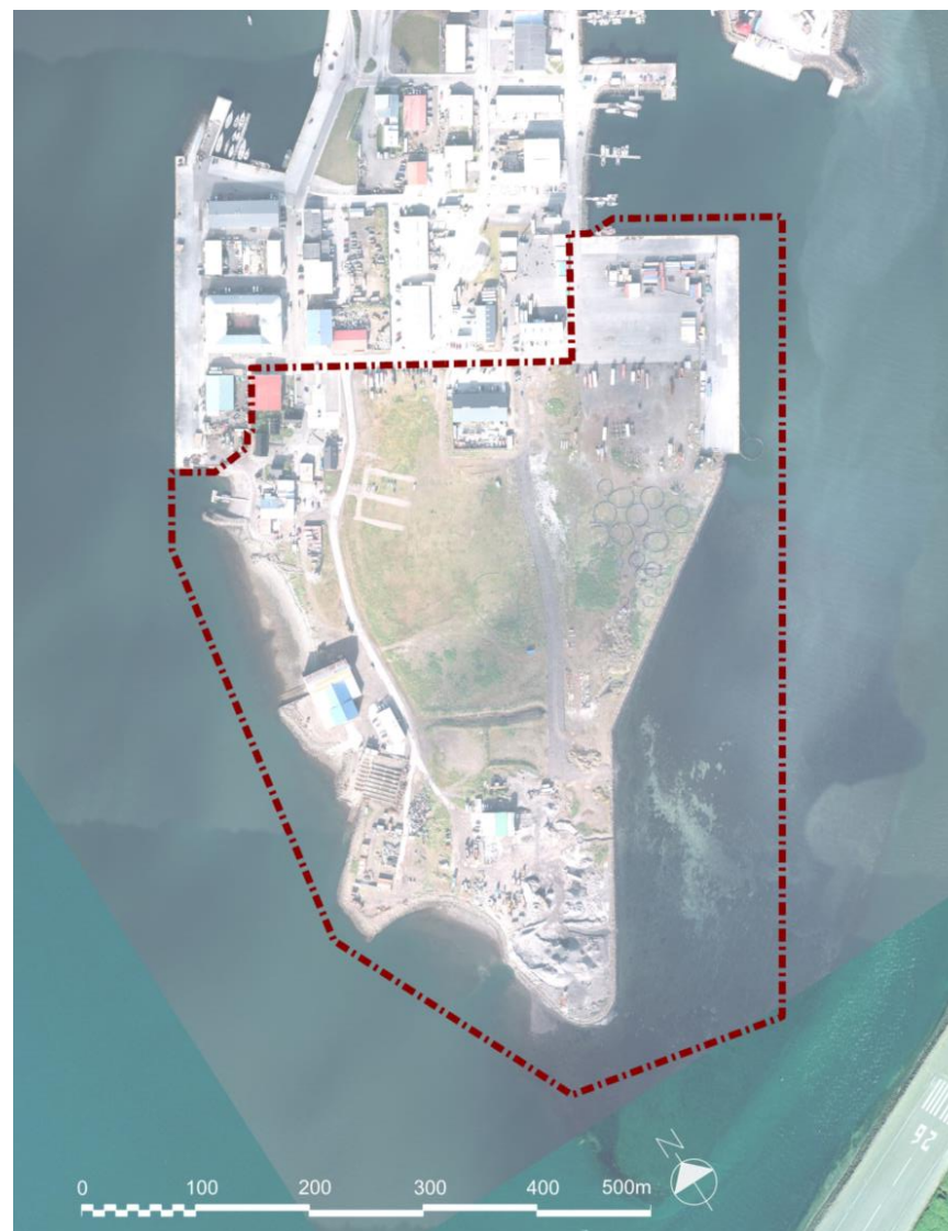
Mynd 1 Afmörkun svæðis sem aðalskipulagsbreytingin tekur til.

Skipulagssvæðið tekur til Suðurtanga, sunnan Ásgeirsgötu, sem er neðsti hluti Eyrarinnar (Mynd 1). Skipulagssvæðið er um 23 ha að stærð. Í gildandi aðalskipulagi er Sundabakki skilgreindur sem hafnarsvæði og innan við hann er iðnaðarsvæði fyrir fjölbreyttan iðnað. Einnig er gert ráð fyrir íbúðarsvæði eftir endilöngum tanganum. Næst sjó á vestanverðum tanganum er svæði fyrir þjónustustofnanir og nyrst er svæði sem tilheyrir miðsvæði. Syðst á tanganum er grænt svæði í gildandi aðalskipulagi.